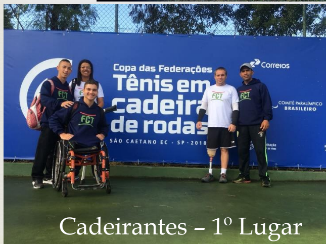
Cadeirantes – 1º Lugar