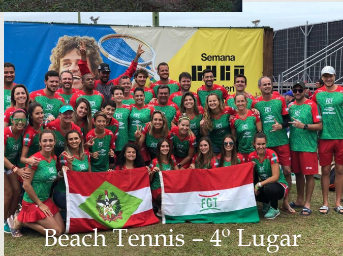
Beach Tennis – 4º Lugar