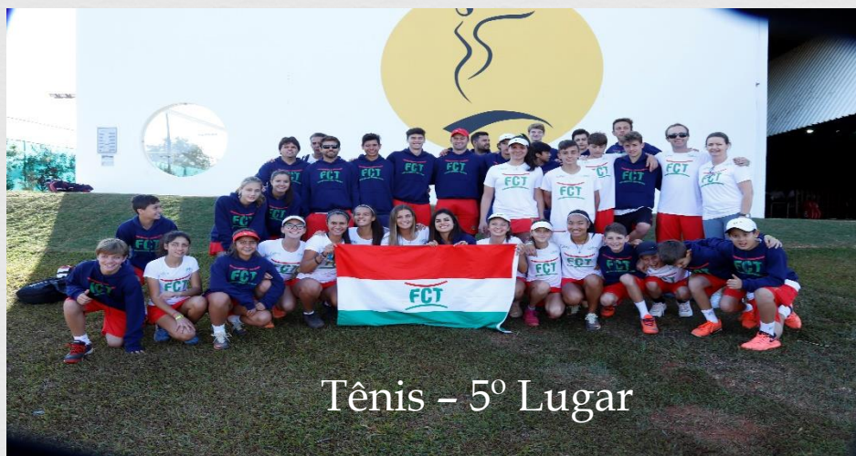
Tênis – 5º Lugar