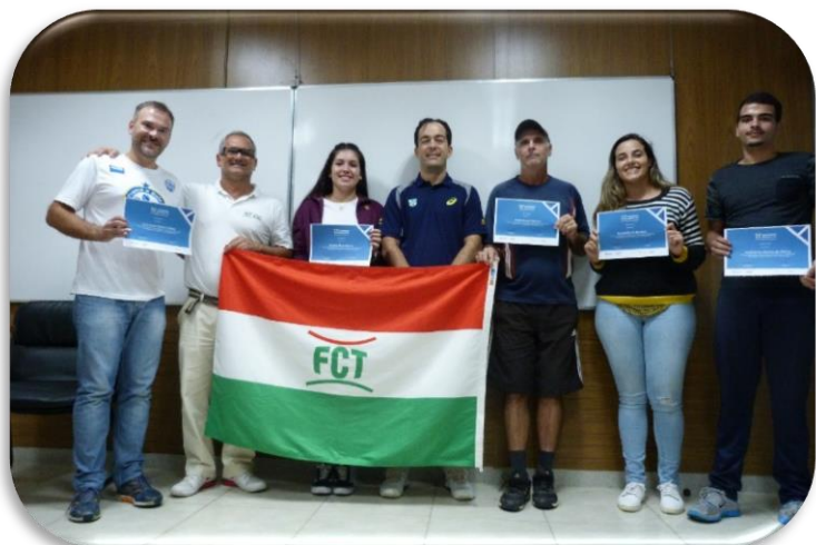
Curso Nacional de Arbitragem