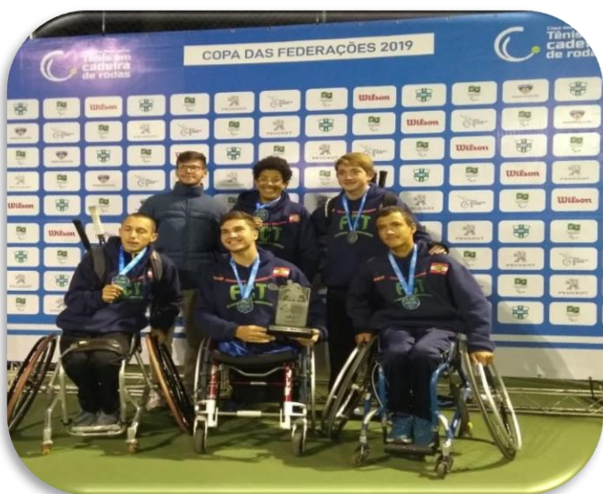
Cadeirantes – 2º lugar masculino