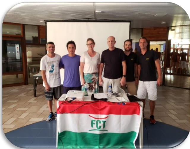
Workshop Sistema Tênis Integrado – Clubes filiados a FCT