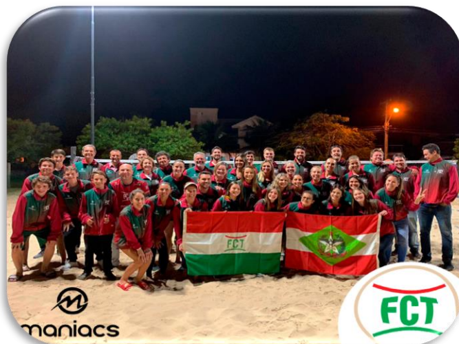
Beach Tennis – 4º lugar geral