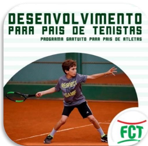
Programa de Desenvolvimento para Pais de Tenistas – Pais de atletas