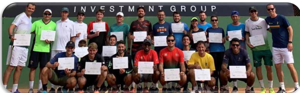
Curso Capacitação Módulo A