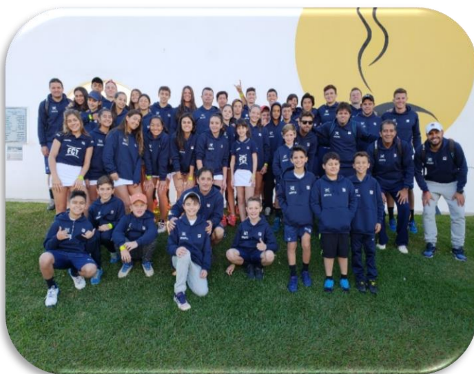
Tênis – 5º lugar geral