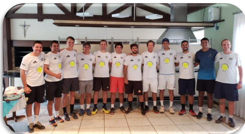
Desenvolvimento para pais : Como contribuir com o desenvolvimento de seu filho tenista - Blumenau SC