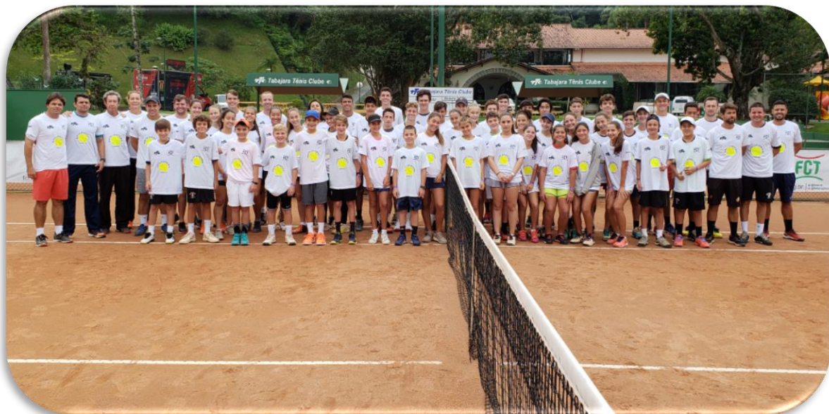
Encontro de Treinamento FCT - Infanto Juvenil - Blumenau SC