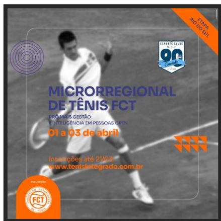
Pró+Gestão Open (Microrregional de Tênis FCT)