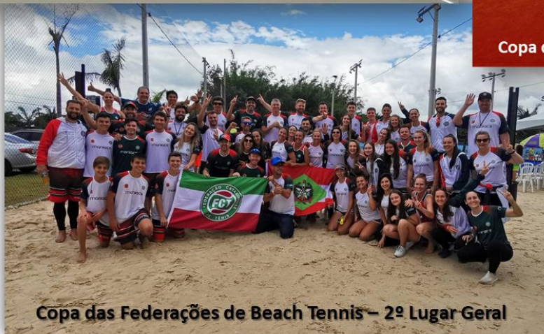
Copa das Federações de Beach Tennis – 2º Lugar Geral