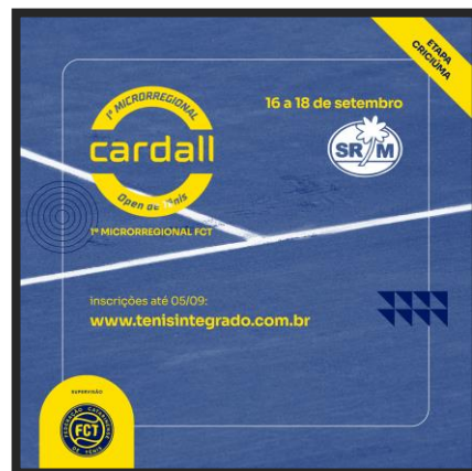
I CARDAL OPEN DE TÊNIS (1º Microrregional)