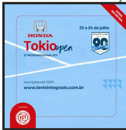
HONDA TOKIO VEICULOS OPEN DE TÊNIS - (2º Microrregional FCT)