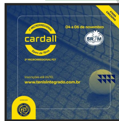
II CARDAL OPN DE TÊNIS (2º Microrregional)