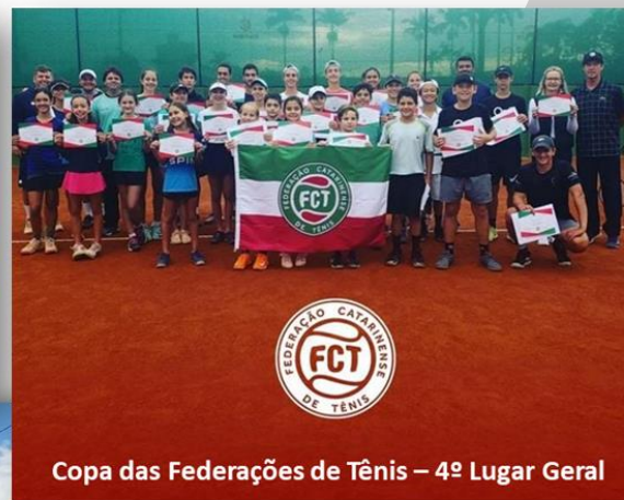
Copa das Federações de Tênis – 4º Lugar Geral