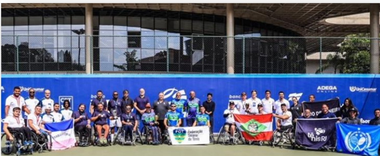
Tênis Cadeira de Rodas – 7º Lugar Geral