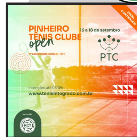
II OPEN PINHEIRO TÊNIS CLUBE (2º Microrregional FCT)